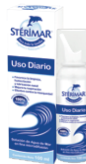
STÉRIMAR ISOTONIC U-DIA SPRAYX100ML ZEUS: 77472 NEPTUNO: 106326