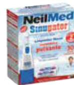
NEILMED SINU GATOR KIT SOBx30 ZEUS: 76079 NEPTUNO: 105257