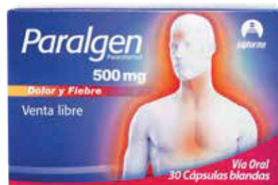
PARALGEN CAP-BLAN x500MGx30 ZEUS: 62083 NEPTUNO: 5179