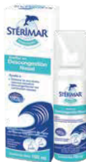
STÉRIMAR HYPERTONIC SPRAYX100ML ZEUS: 77471 NEPTUNO: 1106325