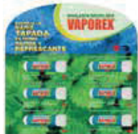
VAPOREX INHALADOR DISP X6