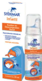
STÉRIMAR INFANTIL SP-NAS HIPERX50ML ZEUS: 77469 NEPTUNO: 106323