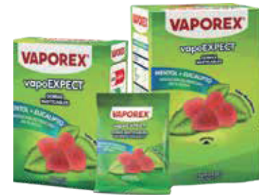
VAPOREX GOMAS MAST SOBx6x4x1