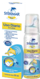
STÉRIMAR BEBE ISOTONIC SPRAYX50ML ZEUS: 77470 NEPTUNO: 106324

Lavados nasales de agua de mar 100% naturales.