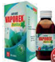
VAPOREX HELIX JBEx120ML