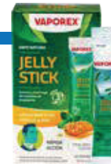
VAPOREX JELLY STICKx10MLx12x1