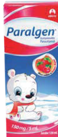
PARALGEN JBEx150MG /5MLx120ML ZEUS: 53777 NEPTUNO: 80599

Producto indicado para la reducción de la fiebre y para el alivio temporal de dolores leves a moderados.