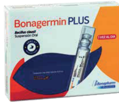
BONAGERMIN PLUS AMP-BEBX5MLX5 ZEUS: 78772 NEPTUNO: 107876

BILLONES DE PROBIÓTICOS QUE TE HACEN BIEN, SIN QUE CUESTEN MÁS