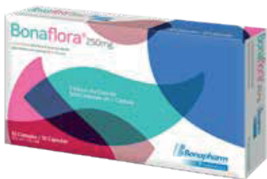
BONAFLORA CAP x250MGx10 ZEUS: 78608 NEPTUNO: 107992