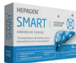
HEPAGEN SMART CAPx680MGx30 ZEUS: 75289 NEPTUNO: 104985

Propiedades antioxidantes para el mantenimiento de función hepática