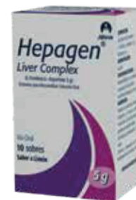
HEPAGEN LIVER COMPLE SOB-GRANx56x10 ZEUS: 74628 NEPTUNO: 104070