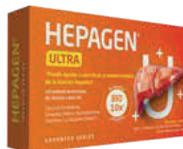
HEPAGEN ULTRA CAPx680MGx30 ZEUS: 75287 NEPTUNO: 104983

Mantenimiento y prevención de la función hepática