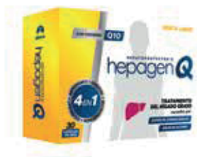
HEPAGEN FORTE CAPx30 ZEUS: 70129 NEPTUNO: 99941