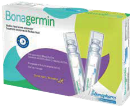
BONAGERMIN AMP-BEBX5MLX10 ZEUS: 77478 NEPTUNO: 106330