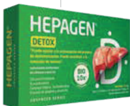
HEPAGEN DETOX CAPx750MGx30 ZEUS: 75286 NEPTUNO: 104986

Estimulación del proceso de desintoxicación y remoción de toxinas del hígado con agentes naturales