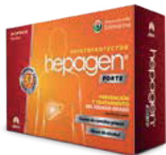
HEPAGEN FORTE CAPx30 ZEUS: 70129 NEPTUNO: 99941

Protección avanzada para el cuidado del hígado. Enfermedades hepáticas crónicas y agudas.