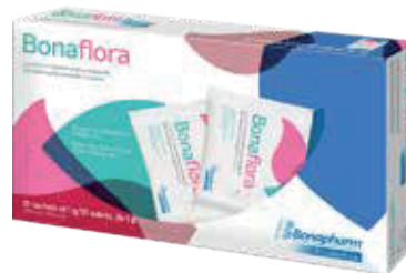
BONAFLORA SOL-ORx10x10 ZEUS: 78607 NEPTUNO: 107694